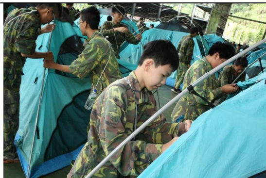
同學互助搭露營帳棚