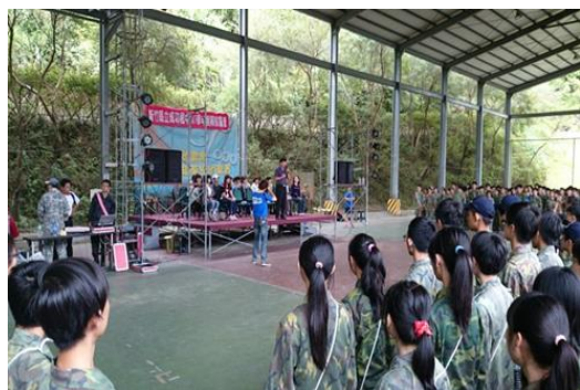
野外訓練開訓儀式